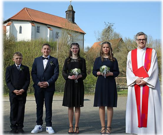
und aus Hammenstedt